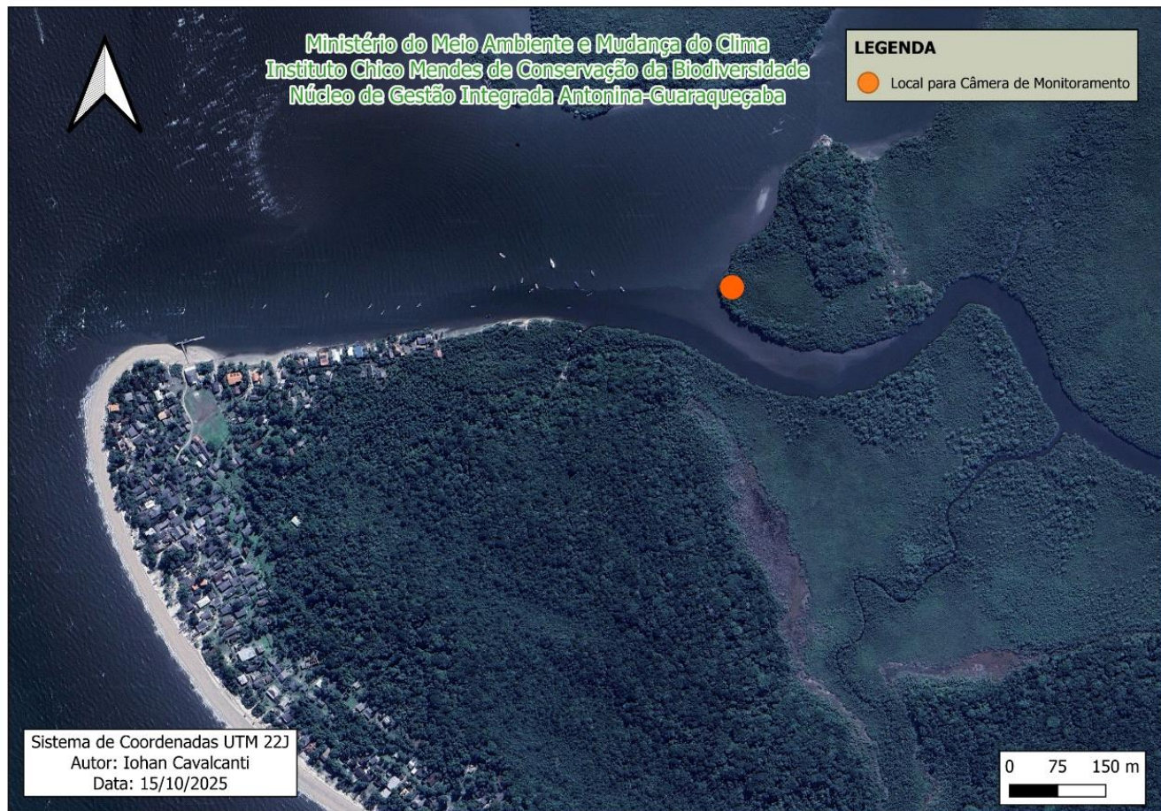
Figura 2 – APA de Guaraqueçaba, com um kit de câmeras na Vila das Peças.

Instalar quatro kits de câmeras de monitoramento no Parna Guaricana e próximo ao posto de polícia ambiental do Cacatu, na entrada da APA de Guaraqueçaba, conforme Figuras 3 e 4.